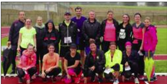
"Une partie des participants lors de la dernière séance"

Pour la dixième année consécutive, la Commune de Manhay a organisé le programme « Je cours pour ma forme ». Ce programme d'entraînement permet à chaque participant d'apprendre ou réapprendre à courir à son rythme.