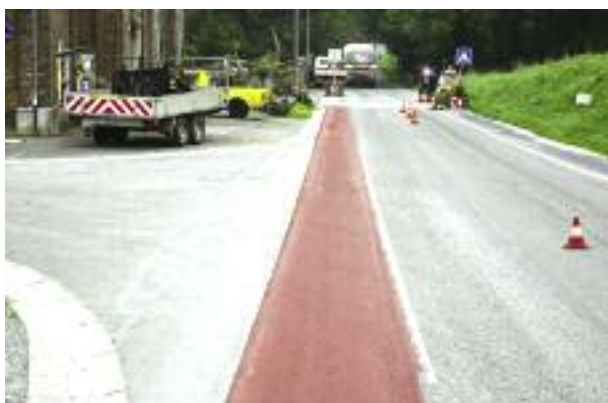
La Piste cyclable à Deux-Rys (Plan mercure)

Adjudication : 120.008,53 €TVAC Subvention : 70.500 €