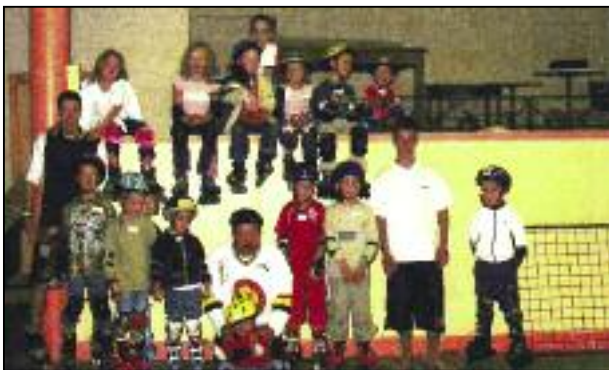
(5 - 7 ans)

Tout comme l'année dernière, le stage de rollers organisé cet été a remporté un très grand succès auprès des jeunes.