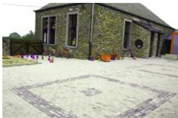
L'école de Harre :

Adjudication : 55.753,35 €TVAC Subvention : 41.370 €