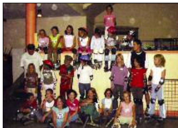
(7 - 12 ans)