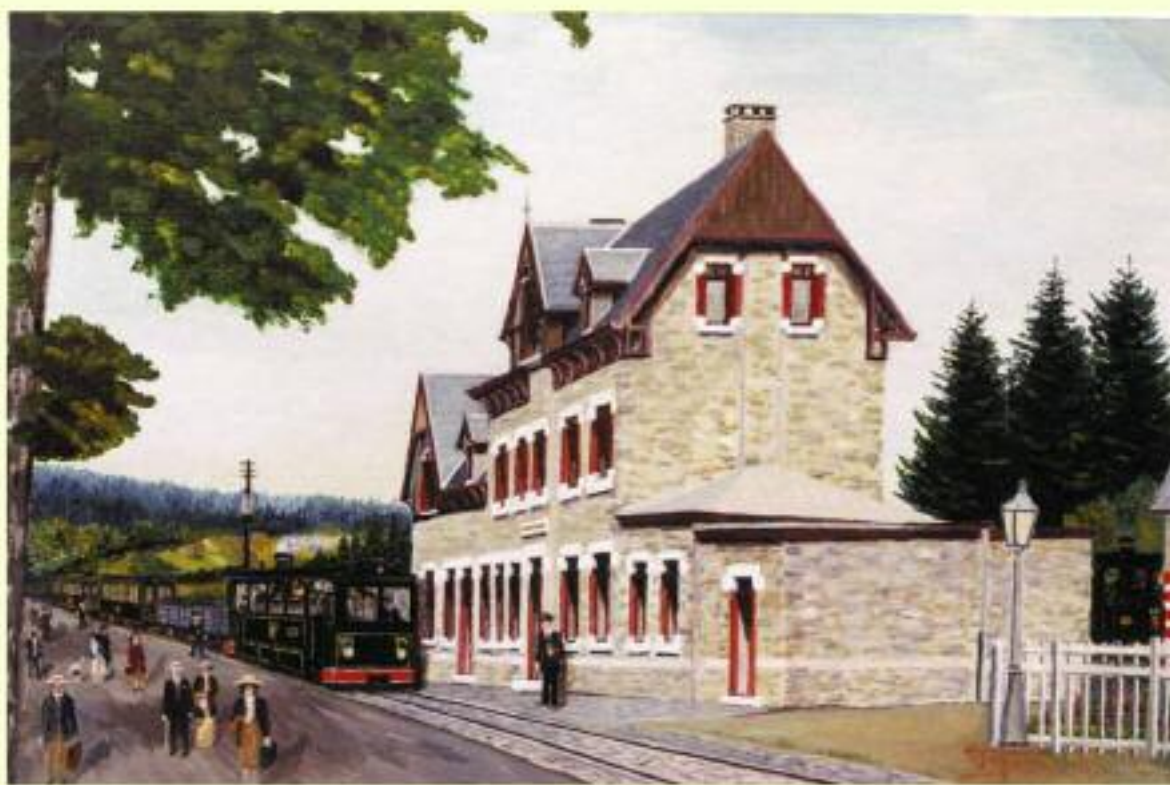
«La gare de Manhay» – (peinture de Roger FAGNANT.)