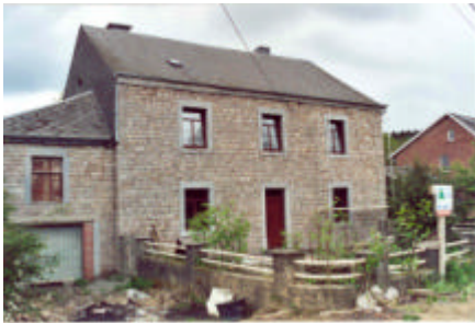
Ancien presbytère de Harre en travaux

De même, l'ancien presbytère de Harre vient d'être transformé en logement et en locaux de rencontre.