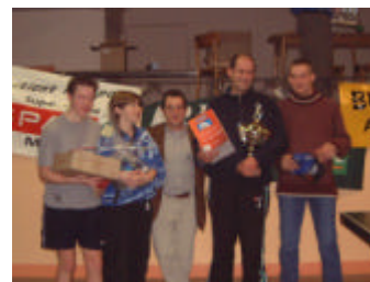
Les vainqueurs de la série OPEN

450 rencontres se sont succédées tout au long de la journée et, grâce au soutien actif de l'administration communale et de l'Echevin des sports, chaque vainqueur a pu brandir sa coupe, sous les applaudissements des nombreuses personnes présentes.