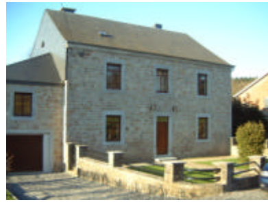
Ancien presbytère de Harre rénové

Plusieurs espaces publics ont également été valorisés par un aménagement adéquat. Il s'agit du Ry de Loon à Harre, de la place Del Tour à Chêne-al-Pierre, de la place de Deux-Rys (en face de la salle) et de la place au centre du village d'Odeigne.