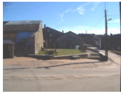
Place d'Odeigne après rénovation

D'autres dossiers sont actuellement en cours. Citons la place du lavoir de Dochamps, l'espace publique d'accueil de Lafosse ainsi que la maison de village de Chêne-al-Pierre.