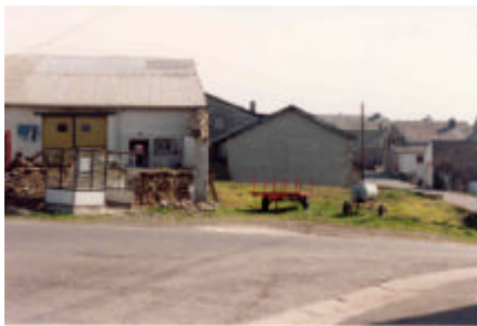
Place d'Odeigne avant rénovation

Plusieurs espaces publics ont également été valorisés par un aménagement adéquat. Il s'agit du Ry de Loon à Harre, de la place Del Tour à Chêne-al-Pierre, de la place de Deux-Rys (en face de la salle) et de la place au centre du village d'Odeigne.