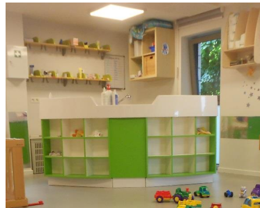
Espace de soins (chênepans)