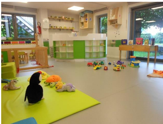
Espace jeux (chênapans)