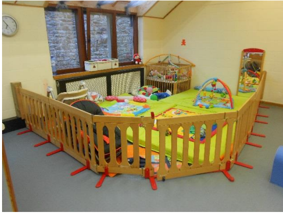
Espace bébé (cigognes)