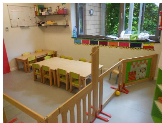
Espace repas (chênapans)