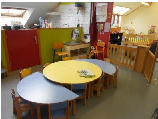
Espace repas (cigognes)