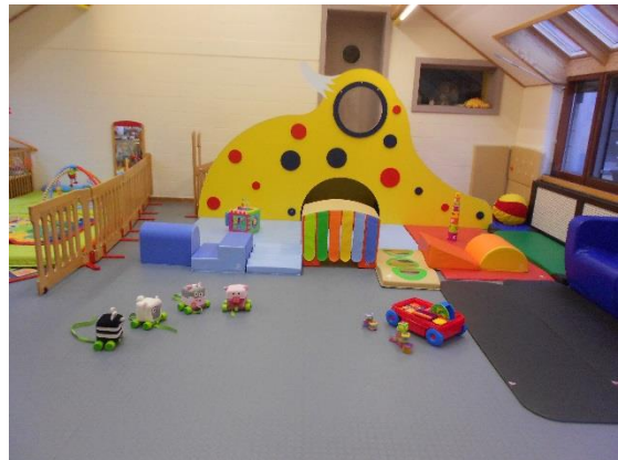
Espace jeux (cigognes)