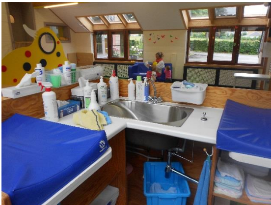
Espace de soins (cigognes)