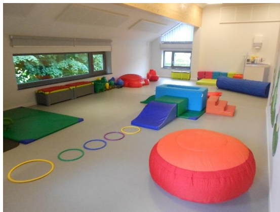
Espace jeux (chênapans)