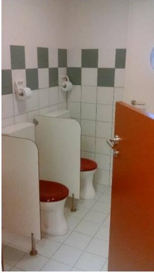
Les wc et l'évier des toilettes sont adaptés à la hauteur des enfants.